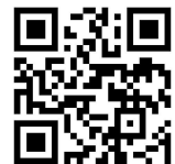
Zum Onlineauftritt der HMP